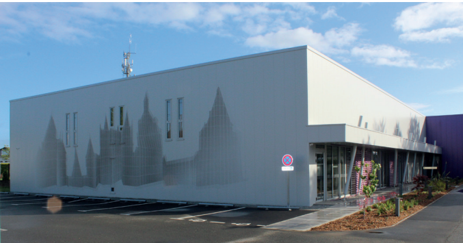
Façade du Centre des archives de Vitré, représentation du château de Vitré par Darcy. Karim OULD, Artiste Plasticien, Projet Lauréat 1% artistique, 2018.

Inscriptions à partir du 27/05, en ligne ou à l'Office de tourisme du pays de Vitré // 02 99 75 04 46 // www.ot-vitre.fr *Payant 2.50 €/pers. Jauge limitée à 20 pers. par visite/présentation carte d'identité.