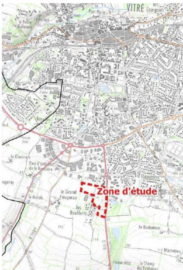
Localisation du projet

La création du parc d'activités de la Briqueterie IV, secteur classé comme zone destinée à une urbanisation immédiate (1AUA) au Plan Local d'Urbanisme de Vitré 1 , se traduira par l'urbanisation de 7,95 ha de terres agricoles constituées de cultures et de prairies. Le parc, constitué de 6 parcelles de tailles diverses pour 5,7 ha hors voiries, permettra l'implantation d'activités principalement d'artisanat, de services et tertiaire 2 . Il s'agit d'un secteur en continuité urbaine, enclavé entre des logements résidentiels au sud-ouest, des terrains agricoles à l'ouest destinés à être prochainement urbanisés avec une dominante habitat, une importante zone commerciale et d'activités au nord, et un axe départemental de circulation à l'est (RD 178). De l'autre côté de cet axe de circulation, le secteur est en partie urbanisé par des activités et des logements.