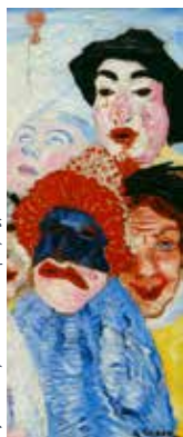
© James Ensor, La Mort et les masques, 1897

Il n'est pas nécessaire d'être danseur ni marionnettiste pour s'essayer sur la piste du bal ! Pour vivre cette expérience festive, venez apprendre la grammaire de la manipulation auprès de la compagnie les Anges au Plafond et devenez les barons du bal. Le regard, le centre de gravité, la respiration, notions élémentaires pour donner vie à la marionnette, se déclinent et s'approfondissent au fil des chorégraphies imaginées pour cette soirée. Devenez dompteur.euse de dentier, valseur.euse de jupe colorée, partenaire d'un soir de Frida Kahlo, dans une fête aux accents latino... Venez en noir, on vous offre la couleur ! Plus d'une quarantaine de marionnettes vous attendent pour prendre le rythme de la danse. Alors, sortez vos chaussures à paillettes et votre plus beau sourire, car comme dans les grands carnivals populaires, on s'apprête à danser sur la tête de la mort !