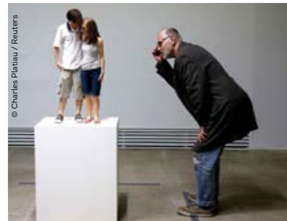
Ron Mueck, Young Couple, 2013

Le monde contemporain offre une part toujours plus grande au spectacle. Cette tendance a ouvert la voie à des propositions artistiques visant à sidérer le spectateur. De nombreuses œuvres actuelles sont ainsi caractérisées par leur monumentalité, voire leur démesure.