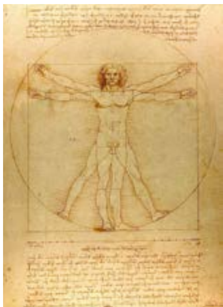
Léonard de Vinci, "l'homme de Vitruve", 1490

Après la construction des grandes cathédrales et la démesure comme expression de la puissance divine, la renaissance propose de replacer l'homme au centre de ses préoccupations intellectuelles et artistiques ; et par là même de reconsidérer l'échelle des représentations.