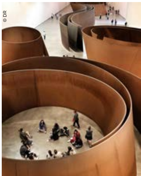
Richard Serra, "The Matter of Time", 1994-2003