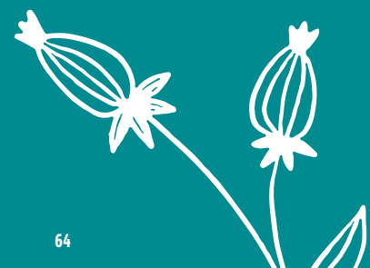
atelier Yohann Pencolé

Le Centre culturel Jacques Duhamel favorise la venue de la jeune génération avec une programmation jeune public à découvrir en famille, des représentations dédiées en séances scolaires et des tarifs accessibles pour les moins de 25 ans. Un parcours de spectacles est proposé à l'ensemble des collèges et lycées du territoire sur les séances tout public. Ainsi, les élèves ont accès à une programmation plus large et vivent une expérience collective avec un public panaché, à l'image de la société. Ils aiguisent leur regard et leur sens critique. Enfin, plusieurs projets d'éducation artistique et culturelle sont également menés auprès des établissements scolaires et d'autres structures jeunesse.