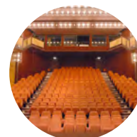
AUDITORIUM MOZART 232 places assises