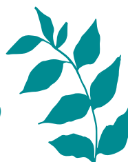
Piano en ville

Artemisia Gentileschi • Groupe Vertigo (p. 30) Jeudi 3 février à 14h15