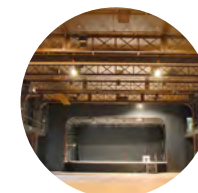
SALLE LOUIS JOUVET 999 places pour les concerts debout et autres configurations