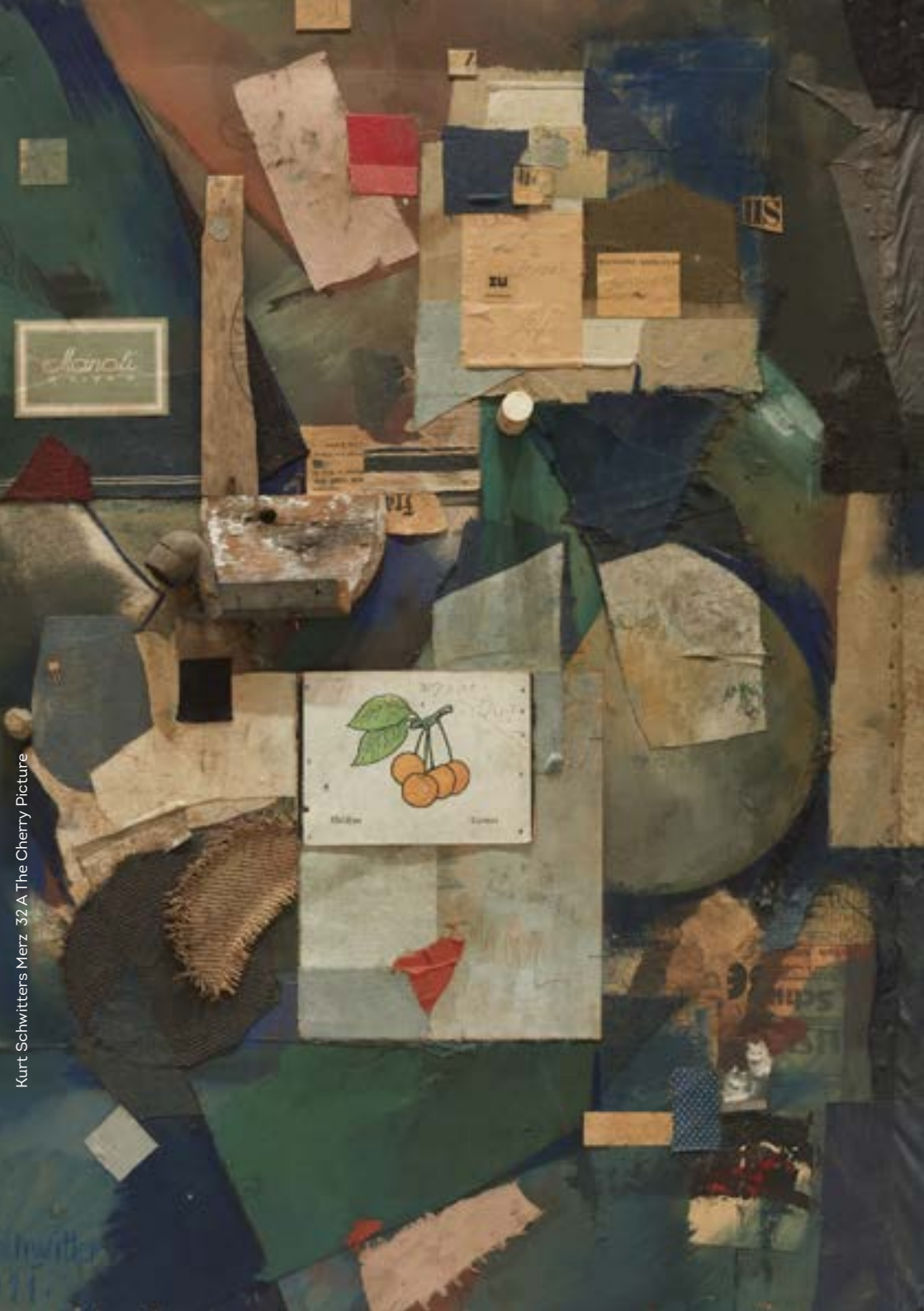
Kurt Schwitters Merz 32A The Cherry Picture