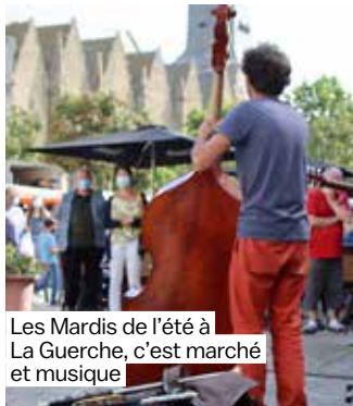
Les Mardis de l'été à La Guerche, c'est marché et musique