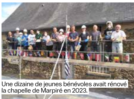
Une dizaine de jeunes bénévoles avait rénové la chapelle de Marpiré en 2023.

Après la chapelle de Marpiré, l'année dernière, le chantier international des jeunes bénévoles pose marteaux et truelles à Argentré-du-Plessis. Une dizaine de jeunes venus du monde entier rénoveront, du 8 au 26 juillet, le mur entre la médiathèque et le presbytère. L'opération, pilotée par le service info jeunes de Vitré Communauté et l'association Études et Chantiers, recherche également des volontaires (16-30 ans) qui souhaiteraient participer à cette rénovation. Aucune expérience n'est demandée. Ce chantier a pour objectif de favoriser des liens interculturels mais aussi intergénérationnels car d'anciens professionnels du bâtiment seront présents, avec un référent technique, pour conduire les travaux.