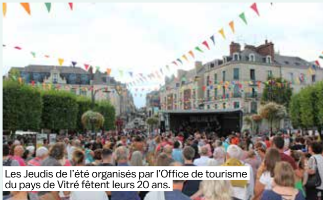
Les Jeudis de l'été organisés par l'Office de tourisme du pays de Vitré fêtent leurs 20 ans.