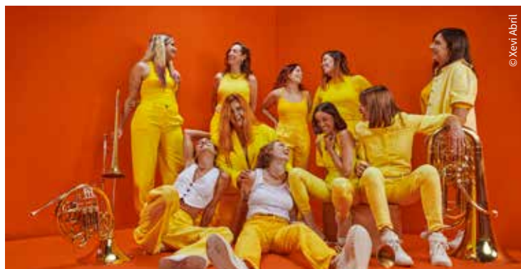
La fanfare 100 % féminine barcelonaise « Balkan Paradise Orchestra » est à l'affiche des Fanfarfelues.