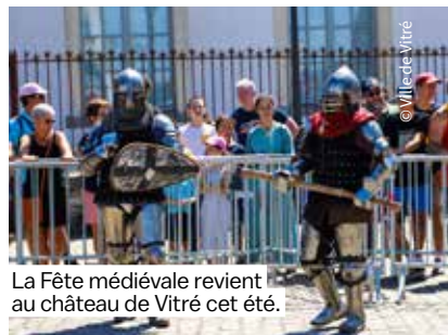
La Fête médiévale revient au château de Vitré cet été.

Assistez à des combats en armure, à des tirs d'artillerie et de catapulte, à des démonstrations équestres. Retrouvez votre âme d'enfant avec des jeux d'enquêtes historiques et des batailles de couleurs endiablées. Sans oublier de vous émerveiller devant des spectacles de jongleries, des farces comiques et des crieurs de rue.