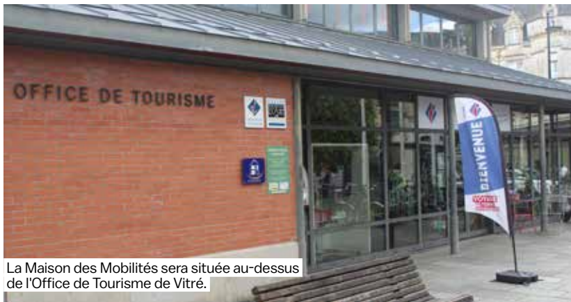
La Maison des Mobilités sera située au-dessus de l'Office de Tourisme de Vitré.

Dans le cadre de la Semaine Européenne de la Mobilité, un événement marquant se prépare : l'inauguration de la Maison des Mobilités. Prévue pour le mercredi 18 septembre, elle se tiendra lors d'une journée dédiée aux mobilités sur l'esplanade Général de Gaulle à Vitré, de 10h30 à 17h.