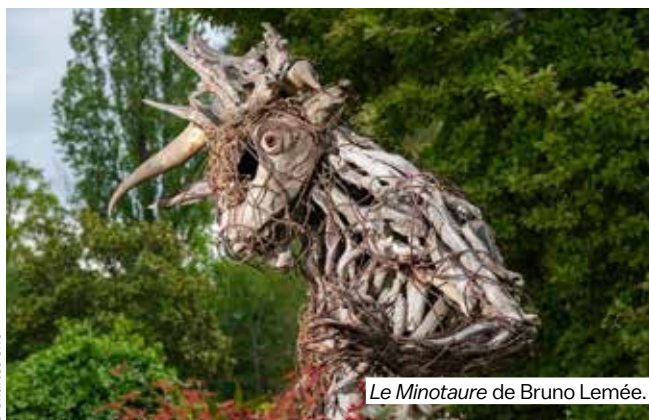
Le Minotaure de Bruno Lemée.

La balade à travers le magnifique parc arboré d'Ar Milin' commence par la rencontre avec Le Minotaure de Bruno Lemée, assemblage de bois flotté dans une anthologie fantastique. Le voyage se poursuit avec les envoûtantes Méduses flottantes délicatement au-dessus de l'eau de Xavier Minard. Au cœur du parc, Soleil et Levant de Thierry Teneul est une invitation à la méditation. Le chemin se prolonge avec les sculptures d'acier de Philippe Le Ray. Les arbres majestueux nous accompagnent tout au long de cette promenade, et sont mis à l'honneur avec Silence, ça tourne , les drôles de hula-hoop de Gilbert Jouan. Plus loin, une apparition surréaliste puis deux semblent jaillir de la prairie. Ce sont Le nageur et Le voyeur , pops peintures en trompe-l'œil de Vincent Fonf. On s'en prend plein les mirettes ! Mais bientôt c'est un univers expérimental et sonore qui s'ouvre à nous. Les œuvres paysages de Christian Delécluse Qi Flowers et Ékhô nous invitent à nous poser un instant, fermer les yeux et ouvrir grand nos oreilles.