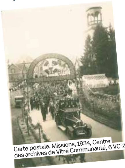
Carte postale, Missions, 1934, Centre des archives de Vitré Communauté, 6 VC-Z

Tasleia, Taslia, Taslie sont les noms donnés successivement à cette paroisse dans les titres du XI e siècle. Le nom de famille de Taillie apparaît dès 1030 dans les textes anciens, « elle possédait toutes les terres de la paroisse sauf la Cherboitière qui appartenait au baron de Vitré selon l'aveu de Damoiselle Gilette de Sévigné, rendu au baron de Vitré en 1602 » 1 .