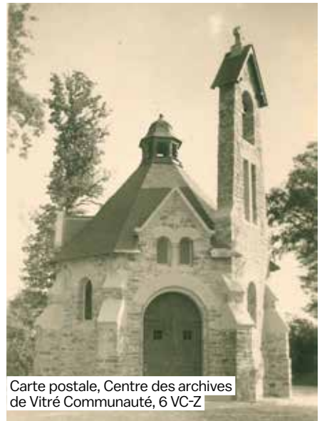
Carte postale, Centre des archives de Vitré Communauté, 6 VC-Z

Il ajoute le 29 août de la même année : « Les travaux de construction de notre chapelle avancent. Les peintres doivent revenir la semaine prochaine pour mettre le point final, ce n'est pas trop tôt parce que nous serons vite rendus au 28 septembre et que surtout je commence à me fatiguer des démarches et des dépenses ».