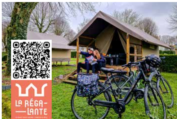
© Vitré Communauté - Julien Audigier