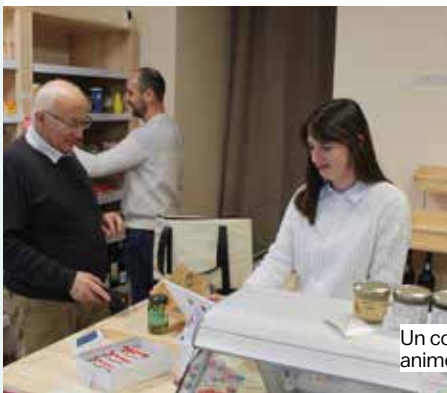
Un commerce de proximité à nouveau animé au cœur du bourg de Princé.

Attachés à la production locale, ils privilégient les circuits courts pour leurs approvisionnements et réfléchissent déjà à de nouveaux projets : élargir les horaires le vendredi soir ou créer un petit espace bar pour la période estivale. En attendant l'installation de la signalétique sur la route départementale, ils savourent les encouragements et les sourires de leurs clients – la plus belle des récompenses.