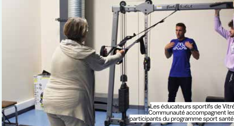
Les éducateurs sportifs de Vitré Communauté accompagnent les participants du programme sport santé.