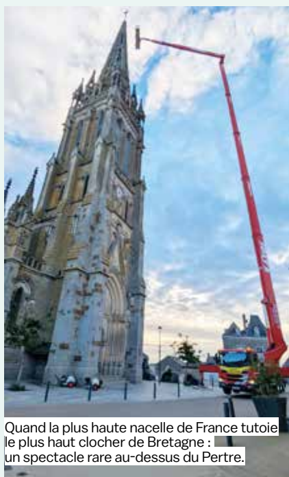
Quand la plus haute nacelle de France tutoie le plus haut clocher de Bretagne : un spectacle rare au-dessus du Pertre.