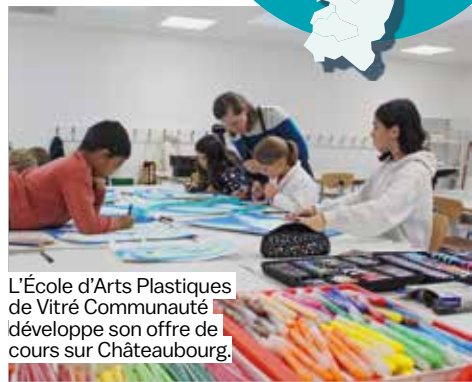
L'École d'Arts Plastiques de Vitré Communauté développe son offre de cours sur Châteaubourg.

La sculpture, au même titre que le dessin ou la peinture, a toute sa place. Assemblage, taille directe, découpe ou modelage, elle offre une grande diversité de techniques, de matériaux et d'approches. Chaque participant avance à son rythme sur des sujets proposés par le professeur, entre exercices dirigés et créations plus libres.