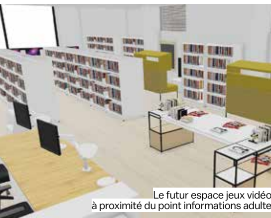
Le futur espace jeux vidéo à proximité du point informations adulte

Après trois mois de travaux, Le Quai des arts rouvrira ses portes le mardi 6 janvier 2026. À 32 ans, l'équipement emblématique avait bien mérité un petit coup