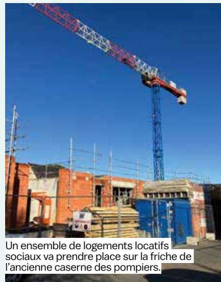
Un ensemble de logements locatifs sociaux va prendre place sur la friche de l'ancienne caserne des pompiers.

Avec un coût global de 2,4 millions d'euros TTC, cette initiative traduit la volonté commune d'Étrelles, de l'agglomération et de Néotoa de proposer un habitat de qualité et accessible à tous.