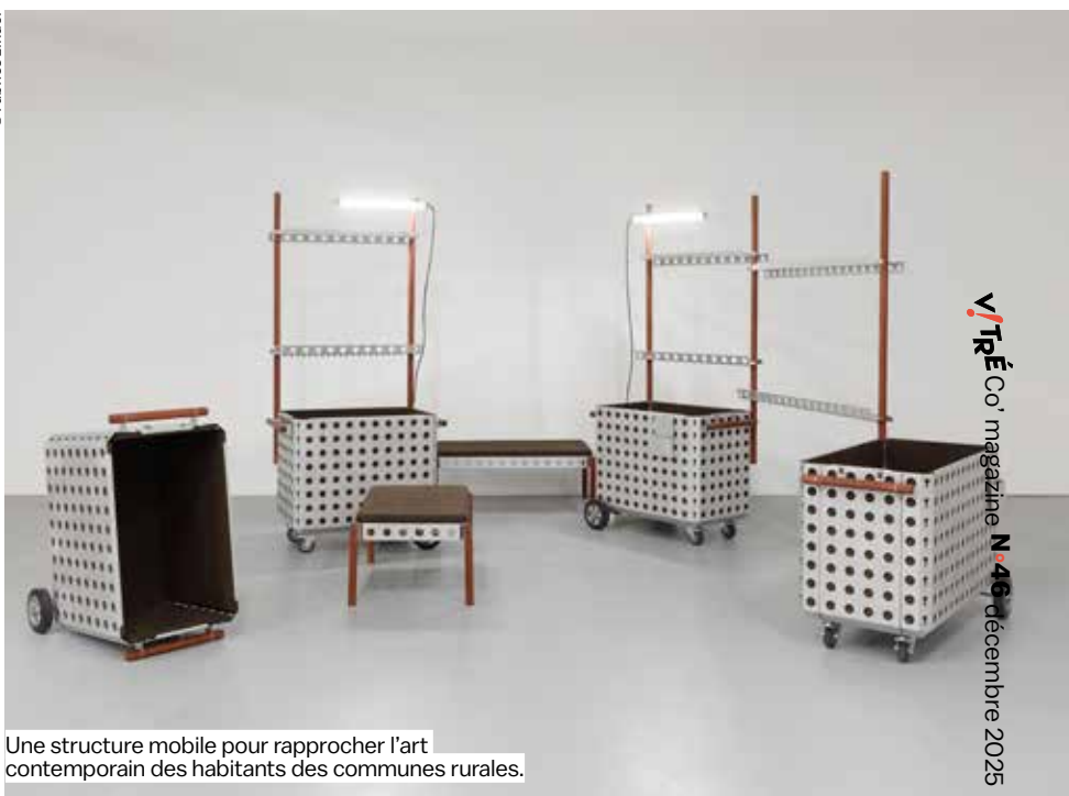
Une structure mobile pour rapprocher l'art contemporain des habitants des communes rurales.