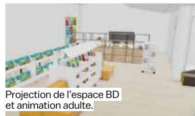
Projection de l'espace BD et animation adulte.

L'espace informatique a lui aussi été repensé pour s'adapter aux nouveaux usages numériques. Et ce n'est qu'un début : d'autres surprises attendront le public dès la réouverture.