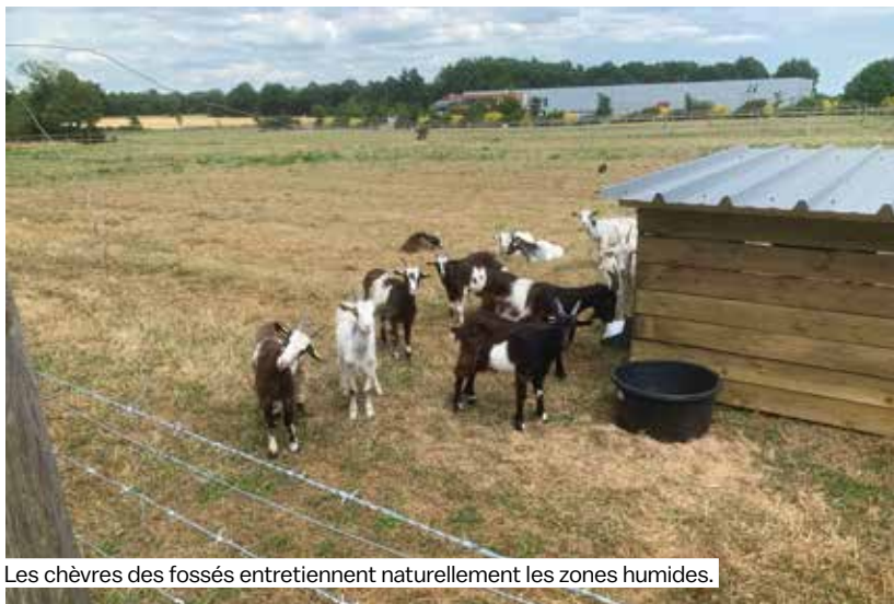
Les chèvres des fossés entretiennent naturellement les zones humides.

Forte du succès de cette première expérience, Vitré Communauté prévoit déjà d'étendre le dispositif. Deux nouvelles