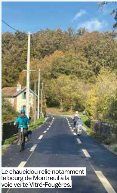
Le chaucidou relie notamment le bourg de Montreuil à la voie verte Vitré-Fougères.